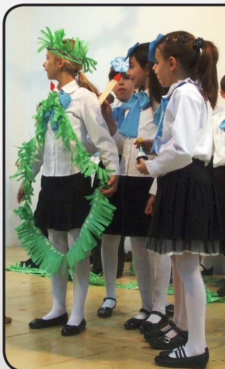
részletek a 11. oldalon