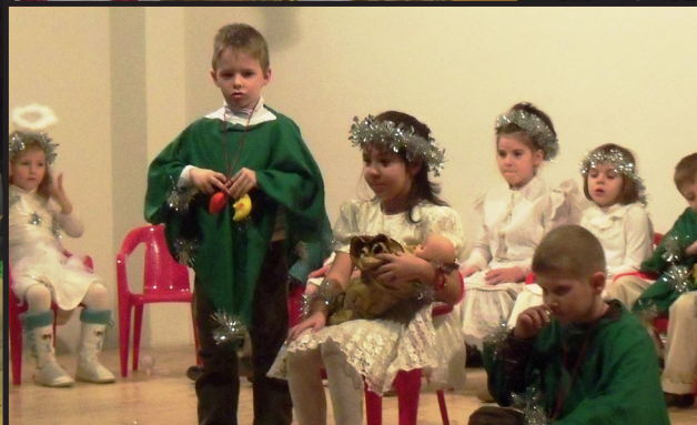
részletek a 10. oldalon