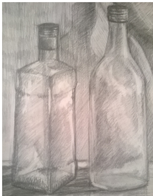
Búza Róbert, 10. A